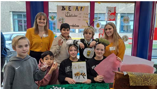
Das Bienenprojekt hatte auch farblich einiges zu bieten

Im Bee Happy-Projekt stand das Leben der Bienen im Vordergrund, stilischer lief Yuma als Biene verkleidet durch die Räume in Merzenich.