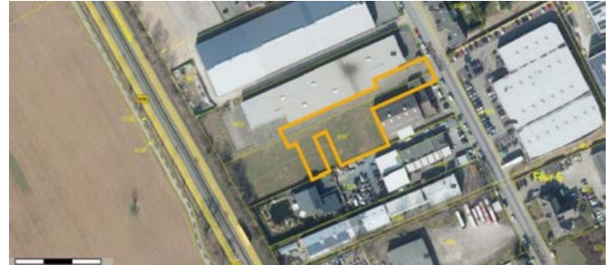
Luftbild mit Abgrenzung des räumlichen Geltungsbereiches (gelbe Linie)

Die Änderung des Bebauungsplanes bezieht sich auf den gekennzeichneten Geltungsbereich, dieser ist in der nachstehenden Skizze dargestellt: