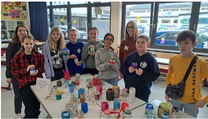
Die Projektgruppen stellten ihre Ergebnisse vor

Daneben spielte natürlich auch Musik und Tanz eine große Rolle. Eine Band, der Chor und zwei Tanzprojekte performten, darunter auch ein Barbie-Projekt. Entspannung gab es beim Yoga-Projekt, sportlich ging es auch beim Spikeball zu.