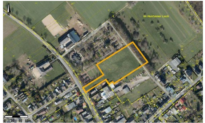
Luftbild mit Abgrenzung des räumlichen Geltungsbereiches (gelbe Linie)

des Gehölzstreifens bestehen Streuobstwiesen. Südlich grenzen Lagerfläche eines landwirtschaftlichen Betriebes sowie Wohn- und Gewerbenutzungen an die Fläche. Dahinter schließt sich die Ortslage Niederzier an. Im Westen der verfahrensgegenständlichen Flächen verläuft die Hambacher Straße. Dort befinden sich zudem weitere Friedhofsflächen. Der Bebauungsplan bezieht sich auf den gekennzeichneten Geltungsbereich, dieser ist in der nachstehenden Skizze dargestellt: