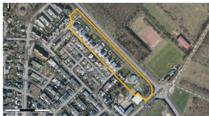
Die Frühzeitige Beteiligung der 19. Änderung des Bebauungsplanes D 02 „Schubertstraße“ wird hiermit gemäß § 3 Baugesetzbuch ortsüblich bekannt gemacht.

Die Änderung des Bebauungsplanes bezieht sich auf den gekennzeichneten Geltungsbereich, dieser ist in der nachstehenden Skizze dargestellt: