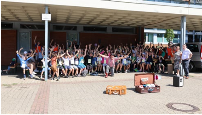
Gruppenfoto zum Abschluss des Ferienprogramms 2023 der Gemeinde Niederzier

Für Kinder im Alter von 6-13 Jahren aus dem Gemeindegebiet bietet die Gemeinde Niederzier seit nunmehr 42 Jahren ein abwechslungsreiches Ferienprogramm an.