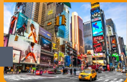
Werbetechnik: Schilder, Textildruck, Rollups uvm.