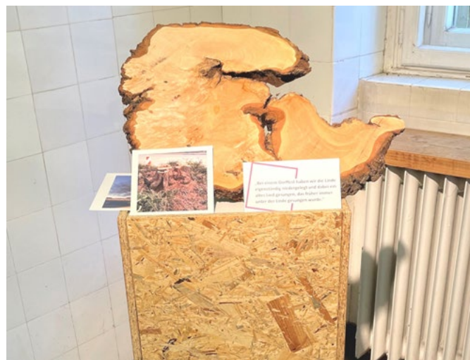
© Silke Freyaldenhoven: Eine Baumscheibe der Dorflinde aus Borschemich ist Bestandteil der Ausstellung in Haus 5 der LVR-Klinik Düren

Die LVR-Klinik Düren ist eine moderne Fachklinik für Psychiatrie, Psychotherapie und Psychosomatische Medizin. Sie übernimmt die psychiatrische, psychotherapeutische und psychosomatische Versorgung der Menschen im Kreis Düren sowie von Teilen der Bevölkerung in der Städteregion Aachen und dem Rhein-Erft-Kreis. Neben den stationären Angeboten gibt es teilstationäre und ambulante Behandlungsmöglichkeiten.