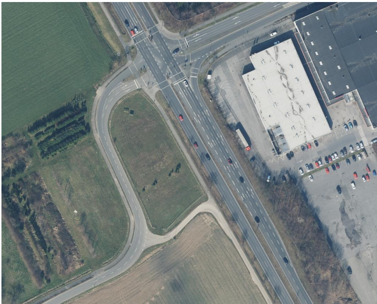
Abbildung 1: Land NRW (2018), Datenlizenz Deutschland - Namensnennung - Version 2.0 ( www.govdata.de/dl-de/by-2-0 ), zugegriffen am 28.09.2018 über https://www.tim-online.nrw.de