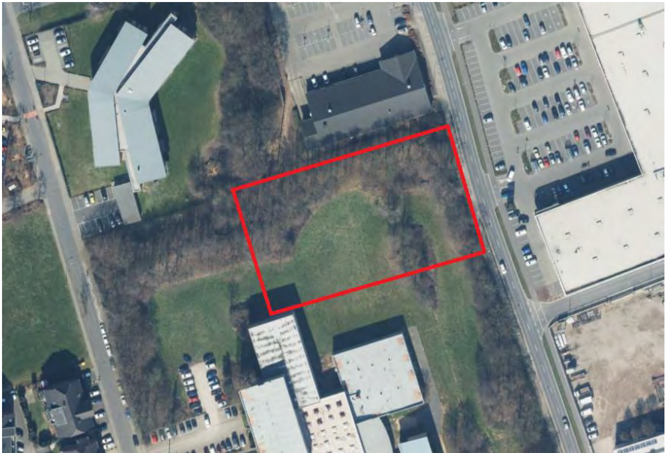
Abbildung 1: Luftbild des Plangebietes (TIM Online, zugegriffen am 01.09.2018)

Das Plangebiet ist derzeit unbebaut. Im nördlichen und östlichen Bereich ist das Plangebiet mit Bäumen bestanden, im übrigen Bereich liegt eine Wiesenfläche vor. Aktuell gehört das Plangebiet zum Schulgelände.