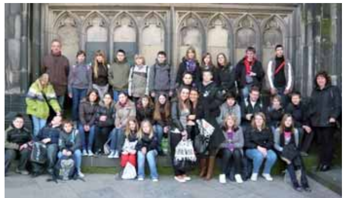
Vier Tage lang besuchten 16 Schüler der französischen Partnerschule die Gesamtschule Niederzier/Merzenich.