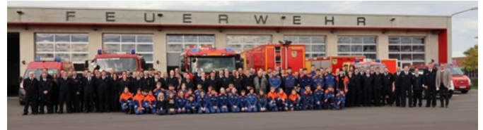
Großes Gruppenbild zur Jahreshauptversammlung d. Freiwilligen Feuerwehr d. Gem. Niederzier