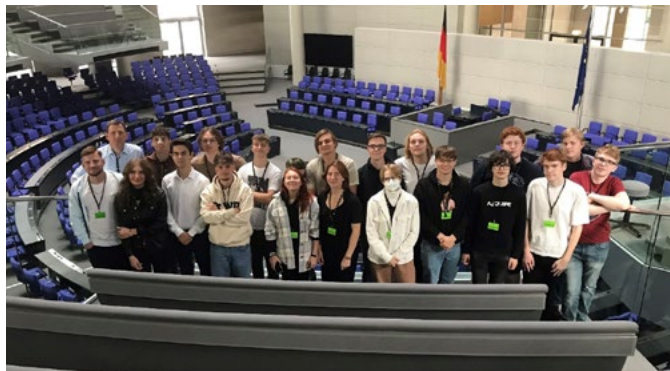
Die Schüler*innen im Plenarsaal

Der 1. Platz beim Nachhaltigkeitsprojekt „Jugend gestaltet den Strukturwandel“ war für den Projektkurs der Gesamtschule Niederzier/Merzenich ein großartiger Erfolg. Dort hatte der Kurs die Ergebnisse eines ganzjährigen Erdkundeprojekts zur beispielhaften Neugestaltung von Orten am zukünftigen Hambacher See in einem überzeugenden Minecraft-Video präsentiert und sich gegen 12 andere Schulen durchgesetzt. Das Projekt zum Thema „Rebuild Revier“ wurde von ANTalive von Aachen aus organisiert, das auch den Wettbewerb ausgerufen und sich um die Preise gekümmert hatte.