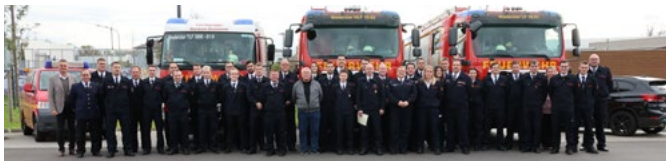
Gruppenbild der Geehrten und Beförderten