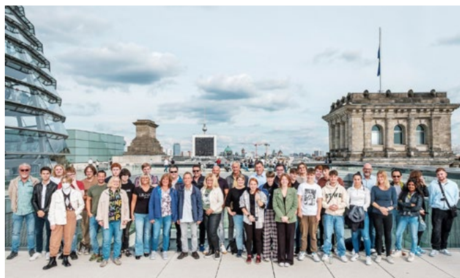
Die Teilnehmer*innen der Berlinfahrt