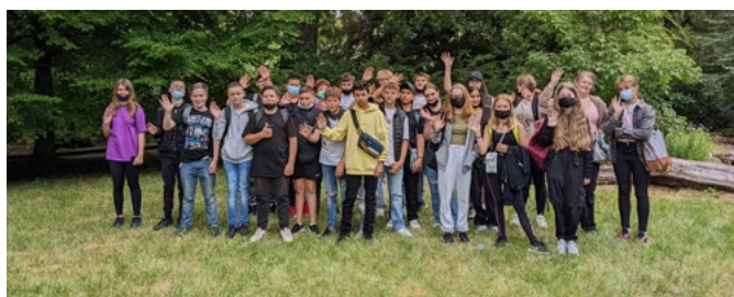
Die 7b besuchte das Institut Geodäsie in Bonn