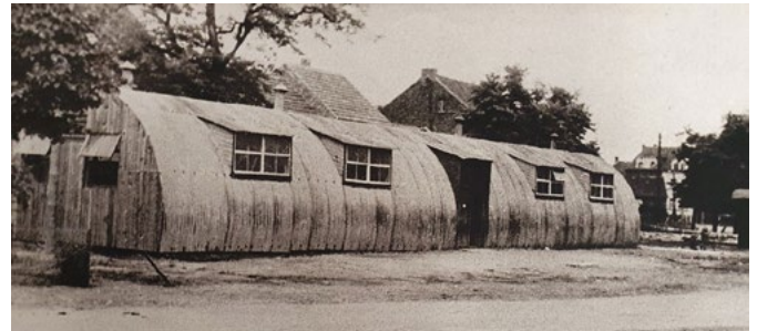
Sogenannte „Nissenhütten“, die nach dem II. Weltkrieg in Oberzier als Schule dienten

Wir treffen uns dazu am Samstag, den 10. September 2022, um 14 Uhr Ecke Kirchstraße/ Friedlandstraße (Parkplätze sind dort vorhanden)