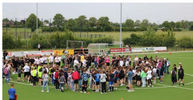
Siegerehrung in Merzenich