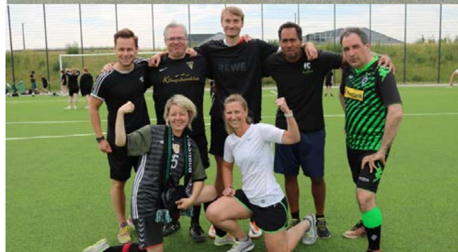
Oben: Niederzierer Siegerteam; unten: Merzenicher LehrerInnenmannschaft