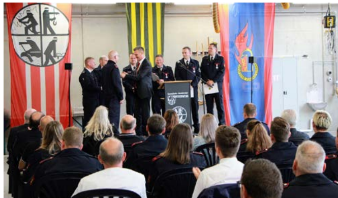
BU: Feuerwehrung im Feuerwehrgerätehaus