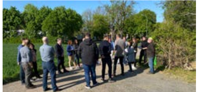
Diskussion am möglichen Fahrradtreff in Hambach.

Der ISEK-Prozess hat erneut an Fahrt aufgenommen. Nach einer Auftaktveranstaltung 2.0 am 25.04.2022 in der Aula der Gesamtschule haben vom 26.04.2022 bis zum 11.05.2022 Ortsspaziergänge in allen sieben Ortschaften stattgefunden. Dort konnten alle Menschen aus dem Gemeindegebiet ihre Ideen und Anregungen für die künftige Entwicklung von Niederzier einbringen. Insgesamt gab es eine rege und konstruktive Teilnahme an den Ortsspaziergängen und viele interessante Diskussionen und Ideen. Es wurden alle Vorschläge aufgenommen und nun erfolgen Überlegungen, wie möglichst viele Maßnahmen über verschiedene Förderaufrufe umgesetzt werden können. Die Bürgerbeteiligung ist damit jedoch noch nicht abgeschlossen. Zeitnah soll eine Onlinebeteiligung über das Portal „Beteiligung NRW“ starten, bei der ebenfalls weitere Ideen und Anregungen gefragt sind. Zusätzlich wird auch eine Kinder- und Jugendbeteiligung durchgeführt, in der auch die jüngere Generation eine Stimme erhält.