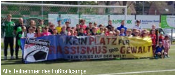
Alle Teilnehmer des Fußballcamps

Alle acht Teilnehmer aus der Gemeinde Niederzier waren sich nach den drei Tagen und trotz der Sprachbarrieren einig, dass es erfolgreiche Tage waren und diese sehr viel Spaß gemacht haben. Wir bedanken uns für diese tolle Initiative.