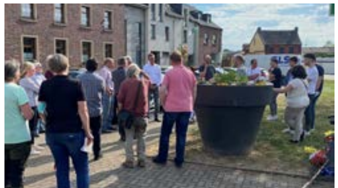
Diskussion am Dorfplatz in Oberzier.

Der ISEK-Prozess hat erneut an Fahrt aufgenommen. Nach einer Auftaktveranstaltung 2.0 am 25.04.2022 in der Aula der Gesamtschule haben vom 26.04.2022 bis zum 11.05.2022 Ortsspaziergänge in allen sieben Ortschaften stattgefunden. Dort konnten alle Menschen aus dem Gemeindegebiet ihre Ideen und Anregungen für die künftige Entwicklung von Niederzier einbringen. Insgesamt gab es eine rege und konstruktive Teilnahme an den Ortsspaziergängen und viele interessante Diskussionen und Ideen. Es wurden alle Vorschläge aufgenommen und nun erfolgen Überlegungen, wie möglichst viele Maßnahmen über verschiedene Förderaufrufe umgesetzt werden können. Die Bürgerbeteiligung ist damit jedoch noch nicht abgeschlossen. Zeitnah soll eine Onlinebeteiligung über das Portal „Beteiligung NRW“ starten, bei der ebenfalls weitere Ideen und Anregungen gefragt sind. Zusätzlich wird auch eine Kinder- und Jugendbeteiligung durchgeführt, in der auch die jüngere Generation eine Stimme erhält.