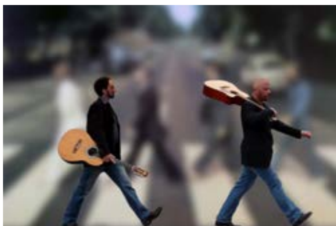
The Man in the Crowd