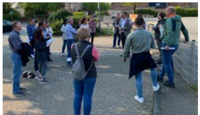
Diskussion an der Grundschule in Huchem-Stammeln.