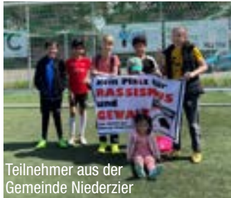
Teilnehmer aus der Gemeinde Niederzier