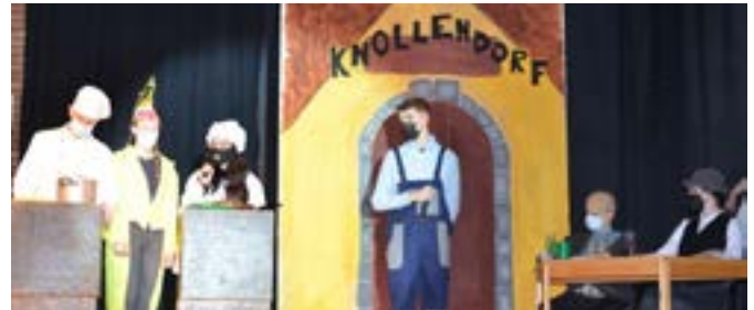
In der Kochshow in Knollendorf gabs auch Kartoffelsuppe.