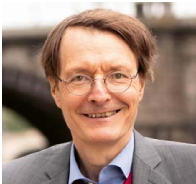
Gesundheitsminister Prof. Dr. Karl Lauterbach