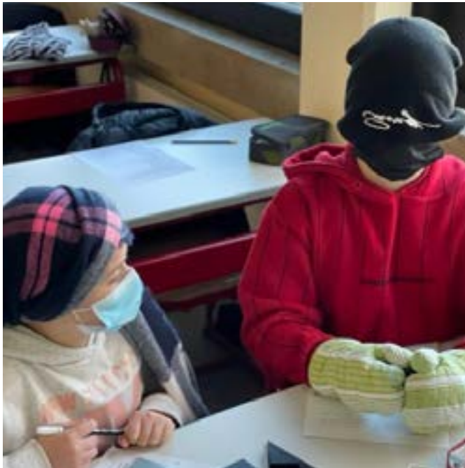
Ein Beispiel für den spielerischen Umgang mit Behinderung

Auch wenn Omikron das ganze Schulleben beherrscht, schaffte es die Gesamtschule Niederzier/Merzenich auch in diesem Jahr den zum Schulprogramm gehörigen Aktionstag „Schule ohne Rassismus- Schule mit Courage“ durchzuführen. Seit 15 Jahren wird diese Maßnahme an einem Tag mit allen Schüler*innen durchgeführt, seit einigen Jahren gibt es feste Projekte für einige Jahrgänge, die sich mit altersrelevanten Themen beschäftigen.