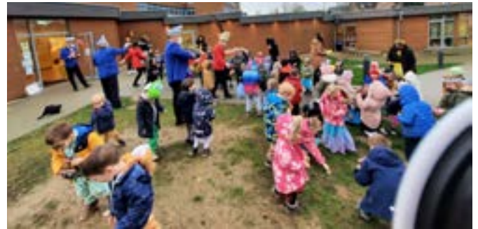
Besuch der Karnevalsgesellschaften