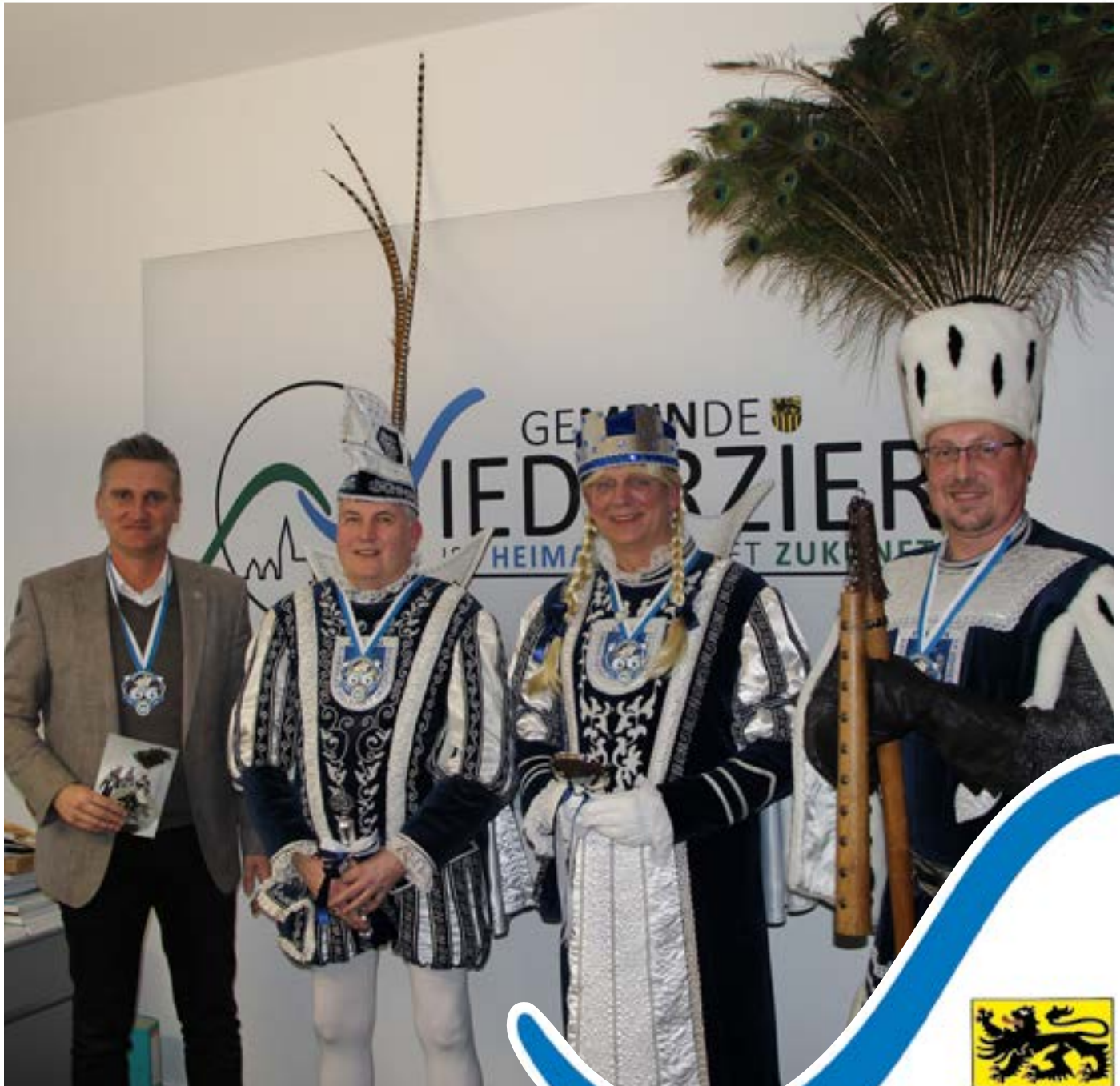
Dreigestirn der KG Grielächer Ellen zu Gast im Rathaus - Bericht im Innenteil