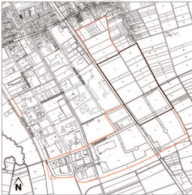
7. Änderung des Bebauungsplanes Nr. 13/ 287 „Talbenden - Rurbenden“

Die Verbandsversammlung des Planungsverbandes Düren-Niederzier hat in der Sitzung vom 29.04.2021 beschlossen, die 7. Änderung des Bebauungsplans 13/287 „Talbenden/Rurbenden“ öffentlich auszulegen. Der Geltungsbereich des Entwurfes zur Bebauungsplanänderung ist in der nachstehenden Skizze dargestellt: