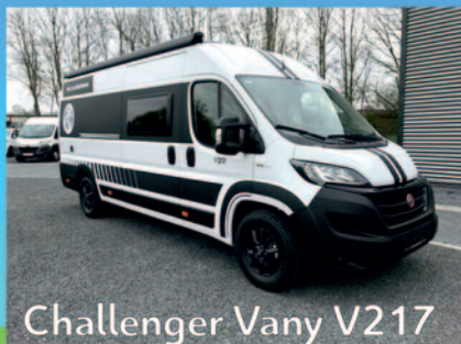
Challenger Vany V217