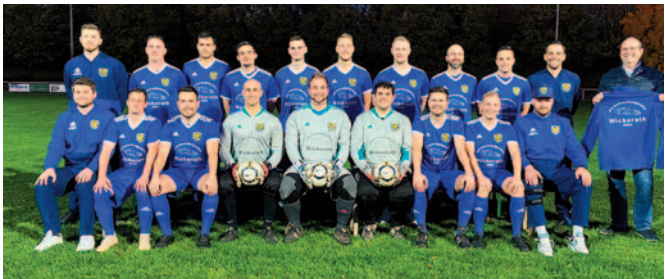
2. Mannschaft mit neuen Trikots von Sachverständigenbüro für Fahrzeugtechnik WICKERATH

Weitere Infos unter www.hambacher-spielverein.de