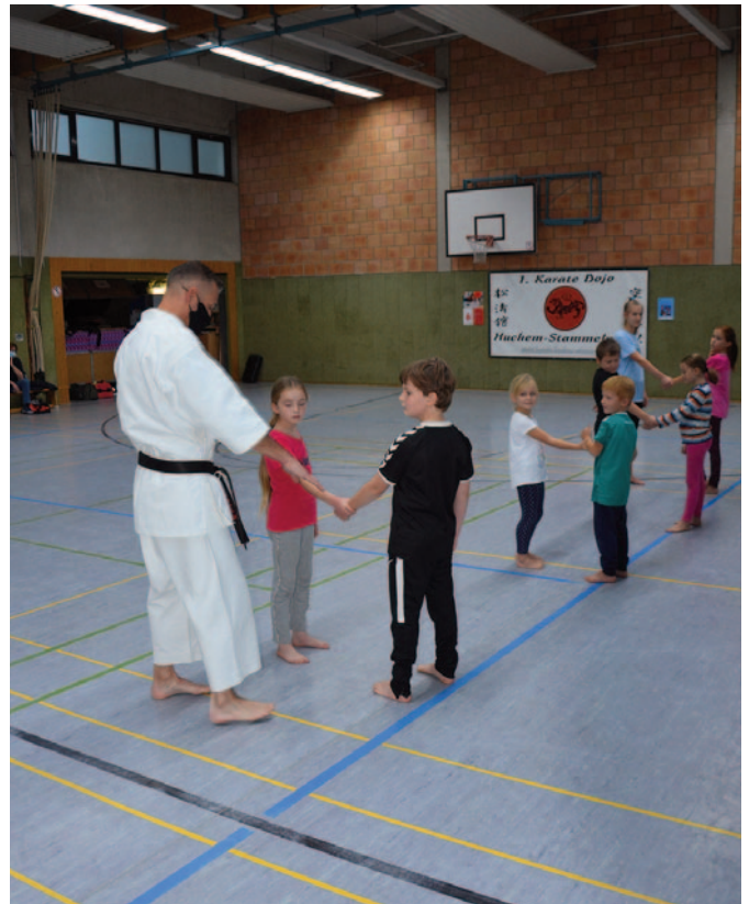
Bilder Stefan Herber