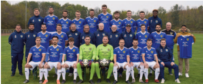
1. Mannschaft mit neuen Trikots von KING'S PIZZA