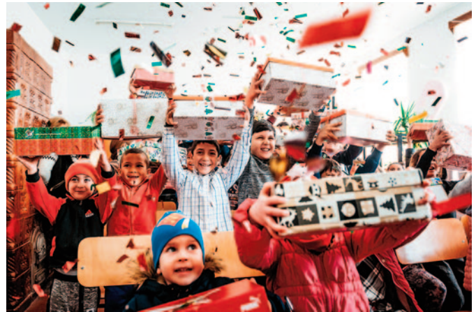
Weihnachten im Schuhkarton feiert 25-jähriges Jubiläum.

Reparatur aller Fahrzeuge TÜV + AU im Haus Kosterloser Leihwagen Inspektionen mit Mobilitätsgarantie