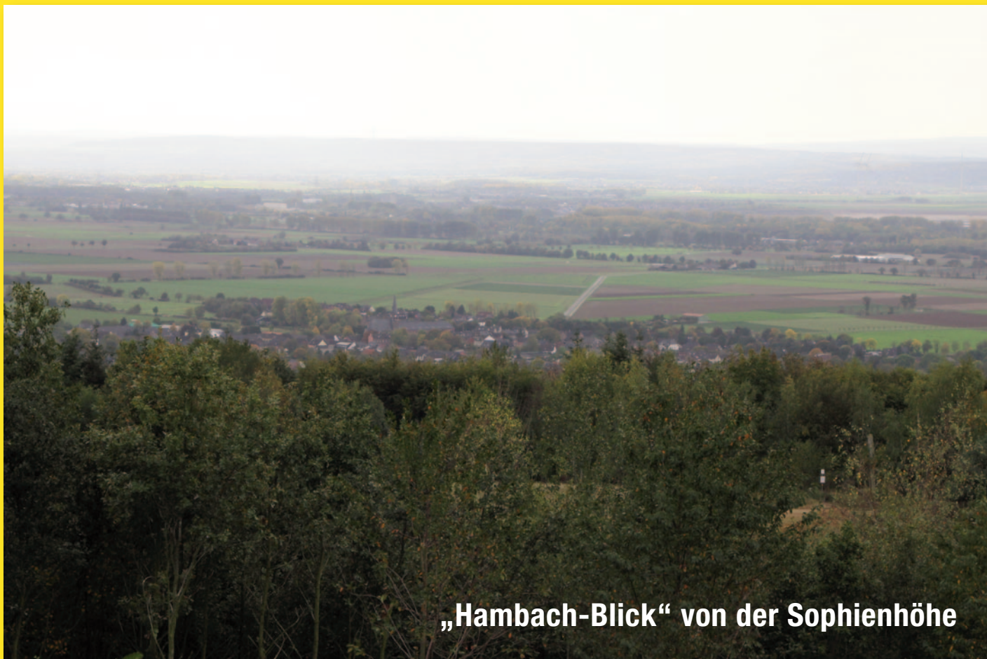
„Hambach-Blick“ von der Sophienhöhe