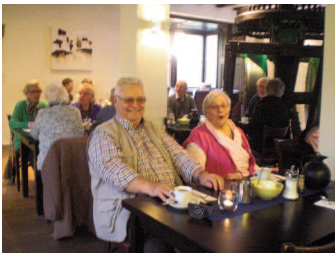
Der Seniorenverein organisiert regelmäßig interessante, kurzweilige Ausflüge.

Wir danken an dieser Stelle noch einmal allen Unterstützern des Vereins, die uns durch vielfache Förderung helfen! Genannt werden sollen hier die Mitarbeiter der Verwaltung, des Bauhofs und der Musikschule. Aber auch viele Unternehmen in Niederzier unterstützen uns durch erhebliche Preisnachlässe bei unseren Einkäufen für Feste etc. Hier möchten wir keine Namen nennen; aber seien Sie versichert: Wir wissen, wer uns unterstützt und unseren Dank werden diese Menschen und Firmen erkennen, denn wir sind recht viele!