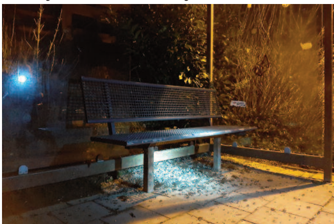
Beschädigte Wartehalle im Reitweg

Zum wiederholten Male wurden Buswartehallen im Gemeindegebiet zum Ziel von Vandalismus. In der Nacht vom 05.02. auf den 06.02.2020 schlugen unbekannte Täter Glasscheiben der Buswartehallen Reitweg und Streffenweg in Ellen ein. Der verursachte Sachschaden beläuft sich auf mindestens 2.500 €.