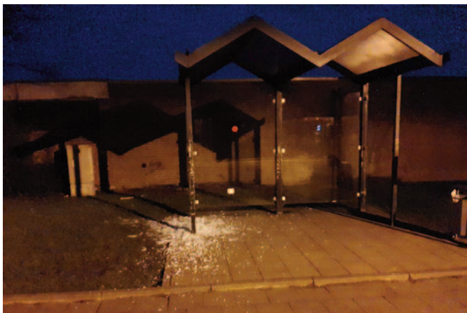
Beschädigte Wartehalle im Streffenweg