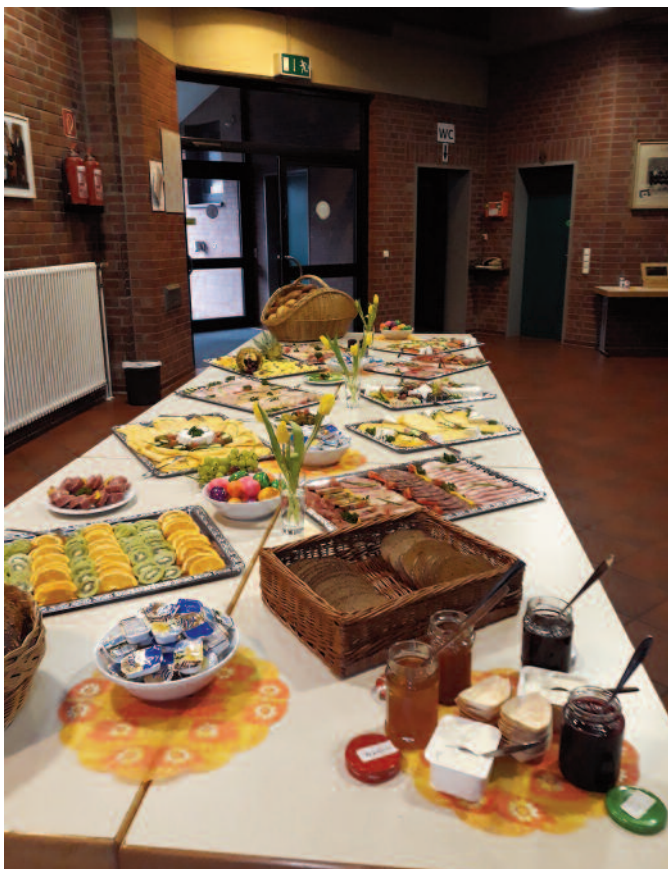
Regelmäßig findet das Seniorenfrühstück statt. Eine gute Gelegenheit zum regen Austausch.

Wir danken an dieser Stelle noch einmal allen Unterstützern des Vereins, die uns durch vielfache Förderung helfen! Genannt werden sollen hier die Mitarbeiter der Verwaltung, des Bauhofs und der Musikschule. Aber auch viele Unternehmen in Niederzier unterstützen uns durch erhebliche Preisnachlässe bei unseren Einkäufen für Feste etc. Hier möchten wir keine Namen nennen; aber seien Sie versichert: Wir wissen, wer uns unterstützt und unseren Dank werden diese Menschen und Firmen erkennen, denn wir sind recht viele!