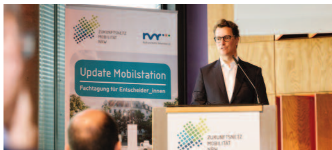
Landesverkehrsminister Hendrik Wüst