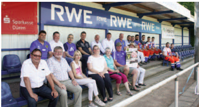
Die neue überdachte Sitzplatztribüne im Stadion des Hambacher Spielvereins 1919 lädt zum Verweilen ein.