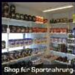
Shop für Sportnahrung