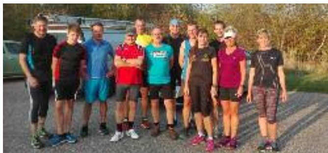
(Training an der Sophienhöhe)