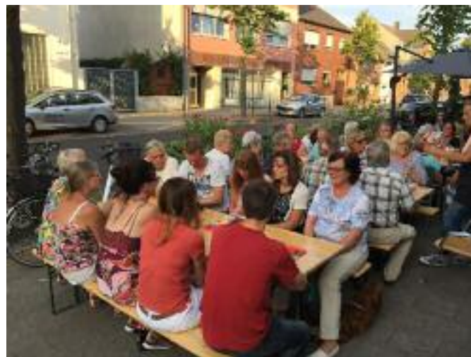
(Eis essen nach dem Training)