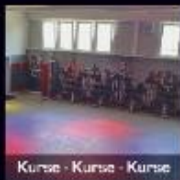
Kurse - Kurse - Kurse