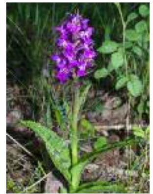
Breitblättriges Knabenkraut