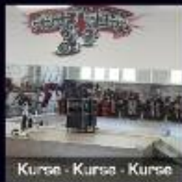
Kurse - Kurse - Kurse