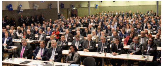
(300 Gäste besuchten die Revierkonferenz in Erkelenz)