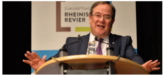
(NRW-Ministerpräsident Armin Laschet auf der Revierkonferenz der Zukunftsagentur Rheinisches Revier)