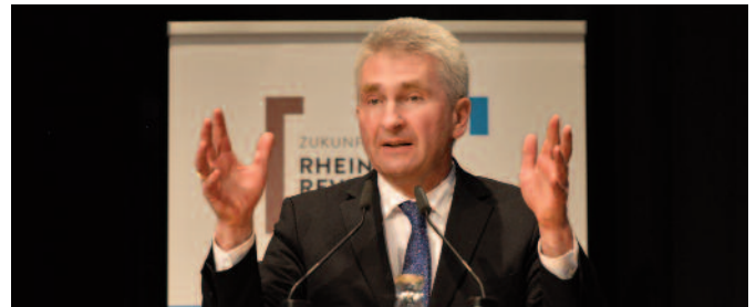
(NRW-Wirtschafts- und Digitalminister Professor Dr. Andreas Pinkwart auf der Revierkonferenz der Zukunftsagentur Rheinisches Revier)