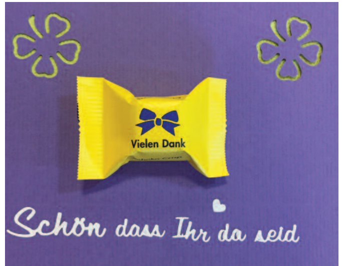
Der Pfarreirat an St. Cäcilia Niederzier