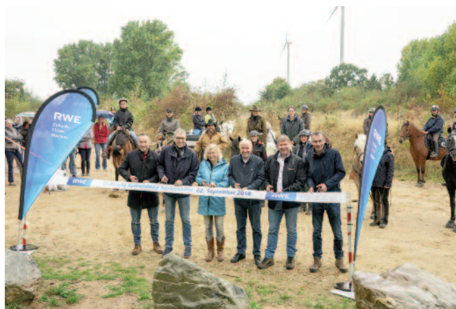
Offizielle Eröffnung am 22. September 2018.