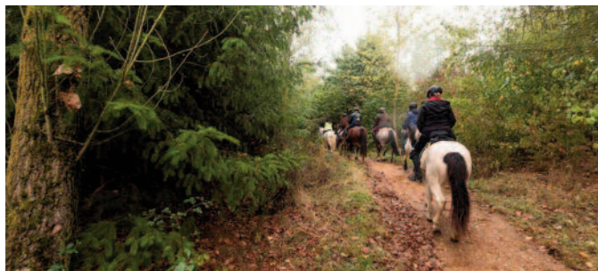
Die Reiter erkunden die neuen Wege.

Die Sophienhöhe erhebt sich 200 Meter hoch über die Jülicher Börde. Sie entstand durch Abraum des Braunkohle-Tagebau und wird seit über 40 Jahren von RWE rekultiviert. Dadurch ist das Gebiet fast vollständig bewaldet und seit vielen Jahren ein beliebtes Naherholungsgebiet.