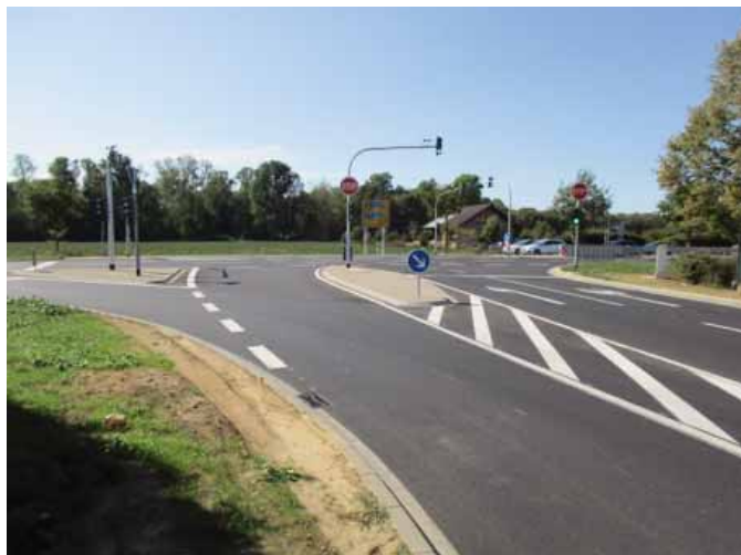
Ansicht aus Blickrichtung Industriestraße

Nach zweimonatiger Bauzeit konnten die Arbeiten zur Errichtung der Linksabbiegerspur an der Bundesstraße 56 / Knotenpunkt Industriestraße, seitens des Planungsverbandes Düren-Niederzier erfolgreich abgeschlossen werden. In Folge des Knotenpunktumbaus ist es ab sofort auch möglich aus Fahrtrichtung Jülich kommend, in das Gewerbegebiet Rurbenden-Talenden einzufahren.