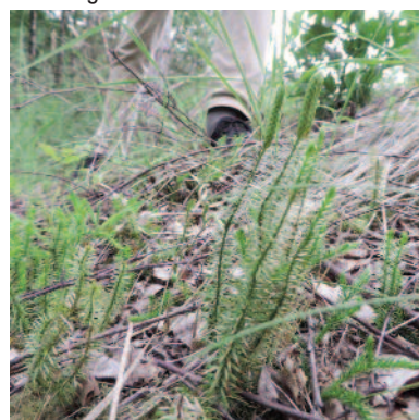
Botanische Sensation: Im schattigen Rand der Sandfläche „Höller Horn“ auf der Sophienhöhe ist der Sprossende Bärlapp ( Lycopodium annotinum) heimisch geworden. Die immergrüne Gefäßsporenpflanze galt früher als Hexenpflanze und wurde als Aphrodisiakum eingesetzt. Die Rote Liste NRW weist sie als stark gefährdet aus.