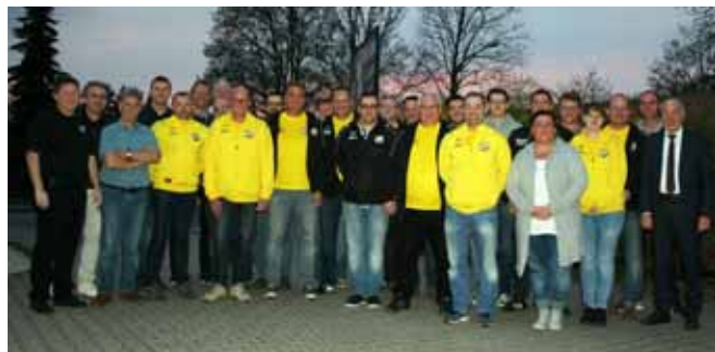
Gründungsmitglieder JFV Sophienhöhe 2018

In diesen Tagen können dann auch über eine eigene Homepage Informationen über des JFV eingeholt werden!