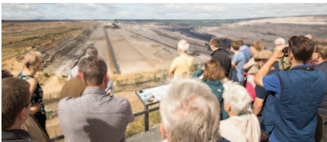
Besuchergruppe am Tagebau Hambach