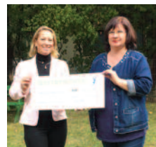
Frau Prinz-Bündgens 2. stellvertretende Vorsitzende des Tierschutzvereins Düren

Alle Vertreter der drei Einrichtungen waren hoch erfreut über die Höhe der Spende, die nicht zu erwarten war.