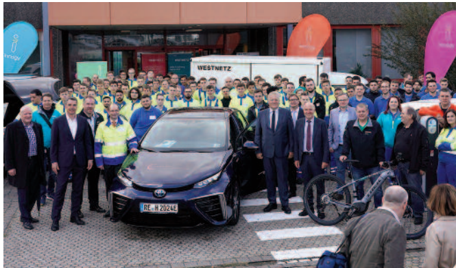
Im Bild: PKW mit Wasserstoffantrieb

Während der Leistungsschau boten viele Unternehmen die Möglichkeit, auch einmal hinter die Kulissen zu blicken und sich einen Überblick über neue Produkte, Angebote und Dienstleistungen zu verschaffen.