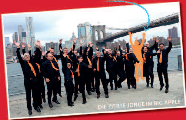
DIE ZIERTE JONGE IM BIG APPLE