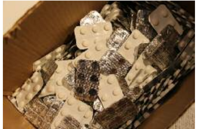
So sehen sie aus, die Blister mit den Jodtabletten.

Alle Infos gibt es auch auf den Homepages der Teilnehmer.