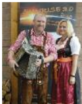
Duo Sunrise 3.0

Für die Beförderung und das leibliche Wohl ist gesorgt. Zur Bestreitung der Veranstaltungskosten wird ein Kostenbeitrag von 5,00 Euro erhoben. Die Kosten für Kaffee und Kuchen werden durch die Gemeinde Niederzier getragen. Sonstige Getränke sind nicht inbegriffen und müssen somit selber gezahlt werden.