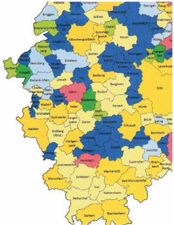
Pro-Kopf-Verschuldung in EUR NRW Gemeinden 31.12.2016

Die nachfolgende Übersicht zeigt die Pro-Kopf-Verschuldung der Kommunen Ende 2016 im Kreis Düren sowie in den umliegenden Kreisen. Quelle: Der Steuerzahler Juli/August 17