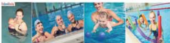
Hallenbad Titz in der Schulstraße 5 in 52445 Titz