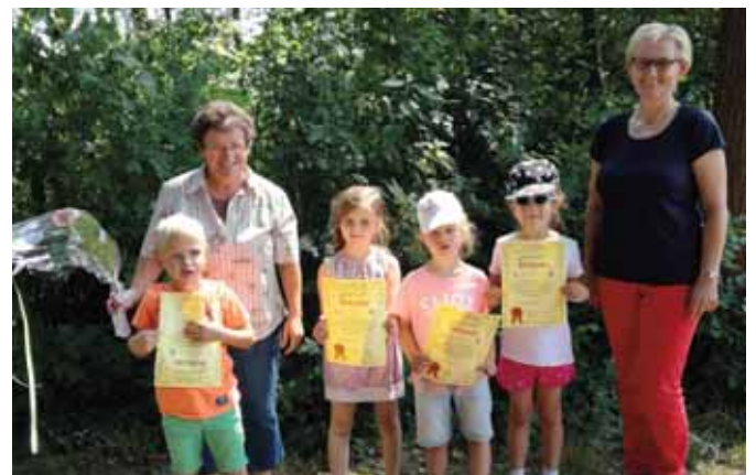
Kindergarten Rappelkiste, Niederzier