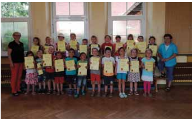
Kindergarten Villa Sausewind, Oberzier