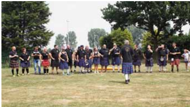
Eröffnung der Spiele durch den Ortsvorsteher.

Ein später stattfindendes Helferfest rundet dies jährliche Ereignis ab. (ug)