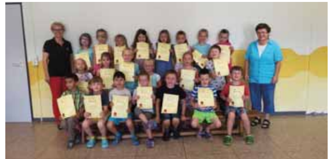
Familienzentrum Rathausstraße, Niederzier