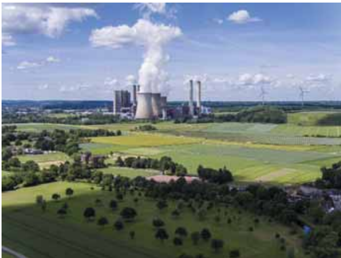
Das Kraftwerk Weisweiler im rheinischen Braunkohlenrevier.

Im Februar 2017 wurde die NRW.URBAN GmbH & Co. KG durch das Ministerium für Wirtschaft, Energie, Industrie, Mittelstand und Handwerk des Landes NRW mit der Erarbeitung der Machbarkeitsstudie zur Entwicklung des „Industriedrehkreuzes Weisweiler – Inden – Stolberg“ beauftragt. Die Beauftragung sowie die Erarbeitung der Studie erfolgt im Rahmen der Innovationsregion Rheinisches Revier und in enger Abstimmung mit der federführenden IRR GmbH.