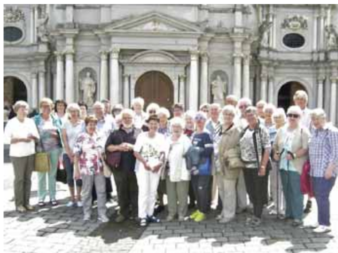
Unsere Pilger und Pilgerinnen vor der St. Matthias-Basilika.