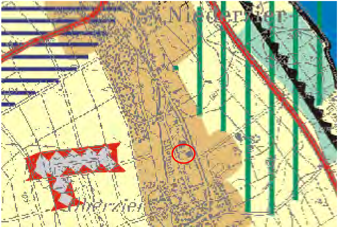
Abbildung 2: Auszug aus dem Regionalplan „Regierungsbezirk Köln, Teilabschnitt Aachen“ ; Quelle: Bezirksregierung Köln