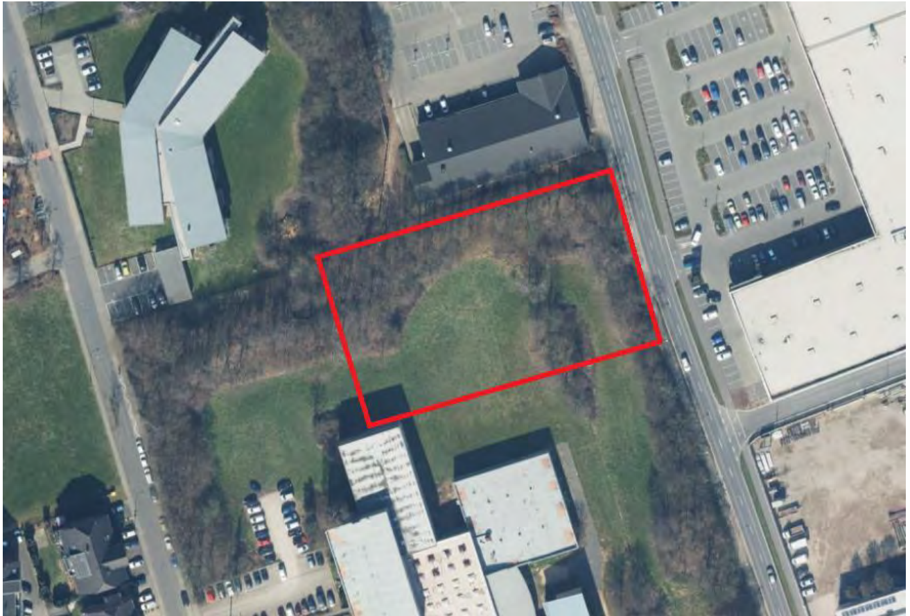
Abbildung 1: Luftbild des Plangebietes (TIM Online, zugegriffen am 01.09.2018)